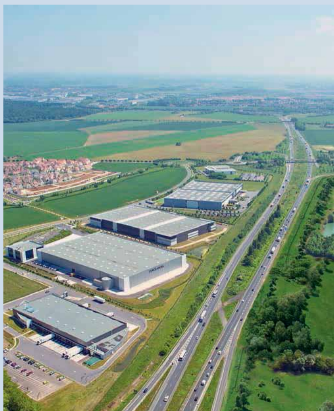
Vue aérienne du parc, entre Évry et Carré Sénart.

L'extension du parc à l'est permet d'offrir un choix diversifié de petites et grandes parcelles, mais aussi de locaux d'activités dans un parc dédié aux PME comprenant 16 400 m 2 de bâti.