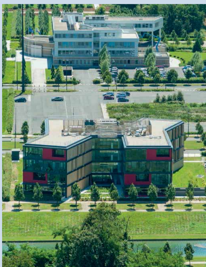
Pôle tertiaire et administratif.

Il se prépare à accueillir de nouveaux équipements consacrés à la culture, aux commerces et à l'enseignement supérieur. Son pôle tertiaire en plein développement permet aux entreprises de toutes tailles de trouver des locaux à leur mesure.